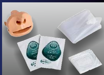
➤ MÁXIMA HIGIENE