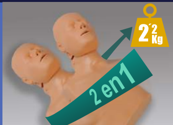
➤ DOS SIMULADORES EN UNO