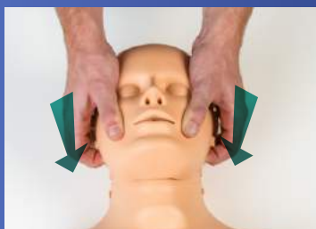
➤ TRACCIÓN MANDIBULAR