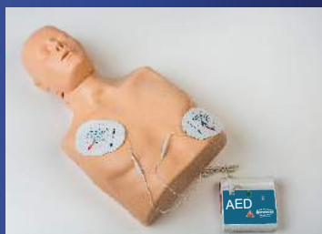
➤ FORMACIÓN DEA