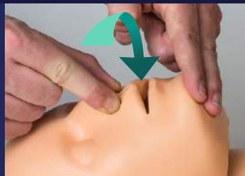
➤ FUNCIÓN DE RESPIRACIÓN: PERMITE LA PRÁCTICA REAL