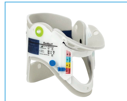
Ambu® Perfit ACE®.