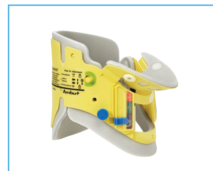
Ambu® Mini Perfit ACE®.